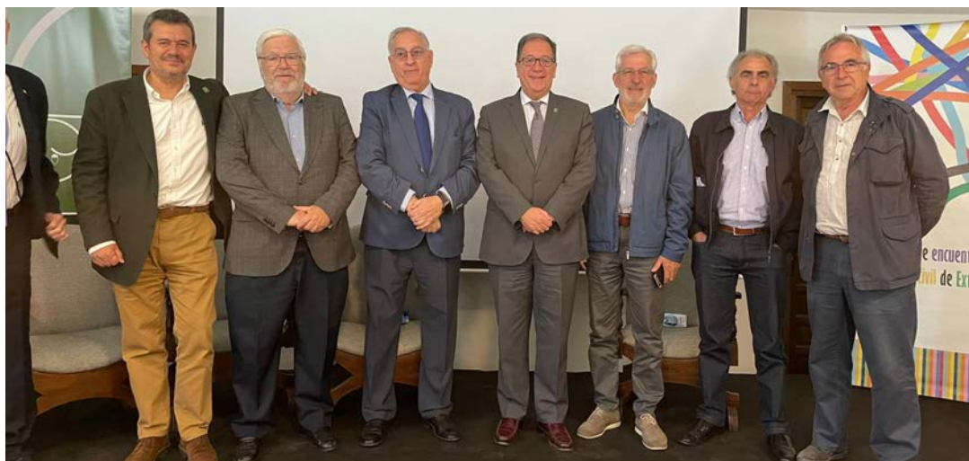
Miembros del Sénior asistentes al debate sobre el proyecto Elysium impulsado por Punto de Encuentro.

Por su parte, el jefe del Ejecutivo regional significó que se trata de un proyecto de 'largo recorrido y muy vinculado con el nuevo concepto de ocio'. Fernández Vara agregó que desde la Administración regional se han hecho lo necesario "para que un proyecto de estas características se pueda desarrollar en Europa, España y aquí y hay que alegrarse por ello".